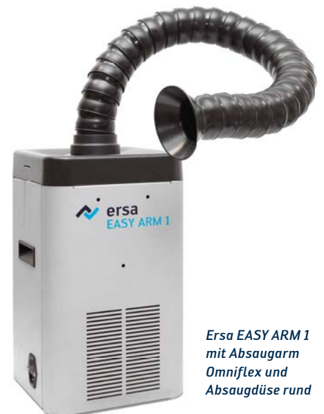
Ersa EASY ARM 1 mit Absaugarm Omniflex und Absaugdüse rund

Zur längeren Nutzung der Filter und zur Energieeinsparung können beide Geräte über eine Schnittstelle mit Ersa i-CON Lötstationen oder einem Standby Schalter verbunden werden. So wird die jeweilige Absaugung nur dann betrieben, wenn mit der angeschlossenen i-CON Lötstation gearbeitet wird.