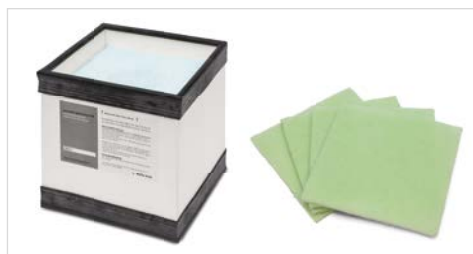
Hochwertige Filtermaterialien, baugleich für Ersa EASY ARM 1 und EASY ARM 2